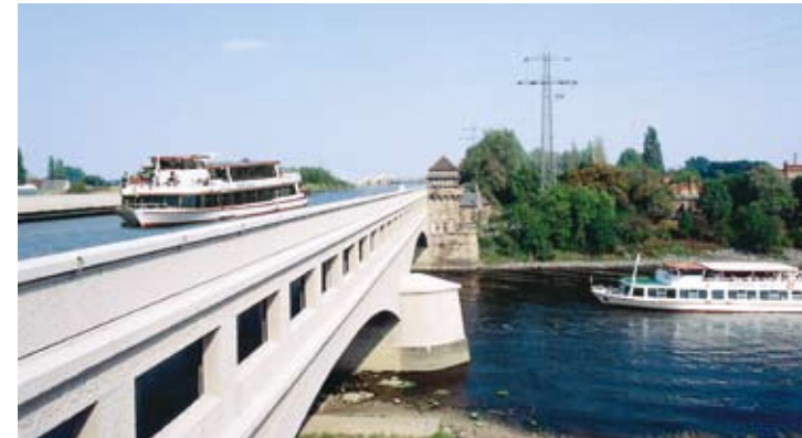
Das Wasserstraßenkreuz bei Minden. The hub of inland waterways at Minden.