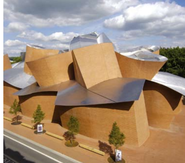
Kunst und Architektur auf höchstem Niveau: das MARTa Herford.

Die pro Wirtschaft GT GmbH ist eine Gemeinschaftsinitiative von Wirtschaft, Städten, Gemeinden und dem Kreis Gütersloh