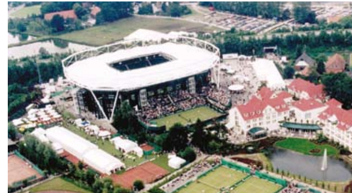
Das Gerry-Weber-Stadion in Halle Westfalen The Gerry-Weber-Stadion in Halle Westphalia