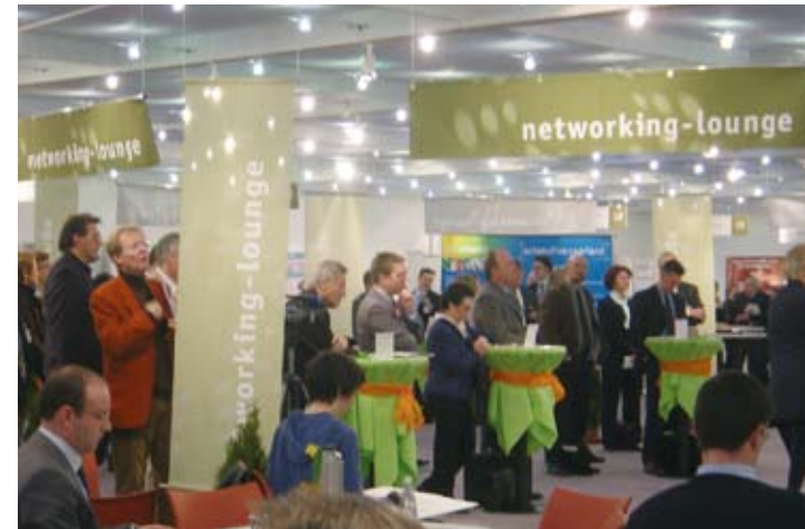
Branchentreff für Netzwerker: Das Messezentrum Ostwestfalen in Bad Salzuffen. | Industry meeting point for networkers: the Messezentrum (trade fair center) Ostwestfalen (East Westphalia) in Bad Salzuffen.