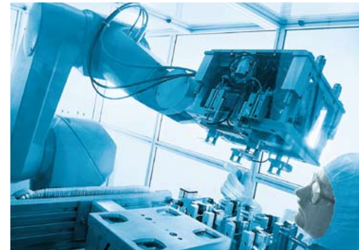
Kunststoffspritzguss unter Reinraumbedingungen. Injection moulding under clean-room conditions.

Konkrete Projekte für kleine und mittlere Unternehmen laufen im Laserschweißen von Kunststoffen, in der Spritzgießtechnik oder im Automotive-Bereich. Aus diesen Projekten heraus sind bereits patentierte Produkte entstanden, die direkt den angeschlossenen Unternehmen zugute kommen oder in ausgegründeten Start-ups vermarktet werden. ■