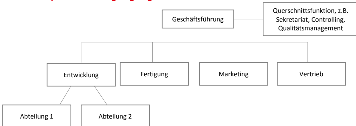
Abb.1: Beispiel Darstellung Organigramm

anderen Mitarbeitern hat. Das Unternehmen wird in arbeitsteilige Einheiten gegliedert, welches mithilfe eines Organigramms dargestellt werden kann (s. Abb. 1).