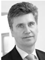
Hubert Böddeker Spar- kasse Paderborn-Det- mold

Die Preisträger werden von einer unabhängigen Jury aus Experten aus Wirtschaft, Wissenschaft und Kapitalgebern ermittelt.