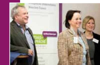
Mittagsgespräch bei Maas, Gütersloh