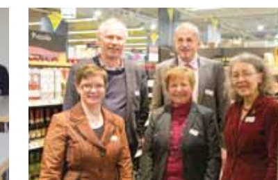
Mittagsgespräch bei Edeka Wehrmann